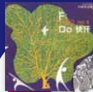
Fit Exercise vol.10