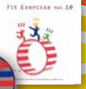
Fit Exercise vol.10