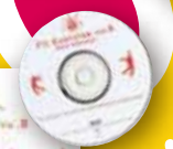
Fit Exercise vol.10