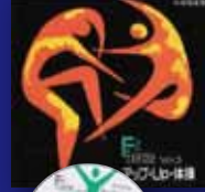
Fit Exercise vol.3 アップ・Up・体操