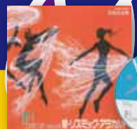
Fit Exercise vol.6 爽・リズムック・アラカルト