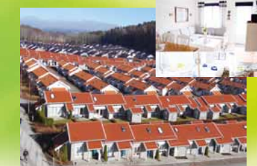
宿泊コテージと宿泊施設内部