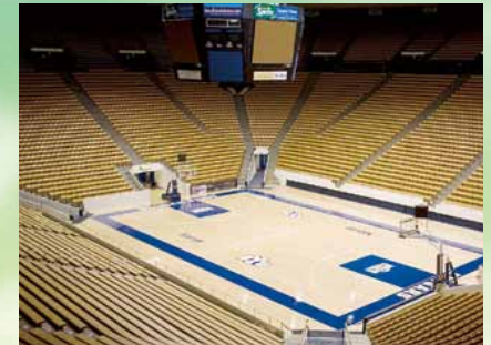
演技発表会場(青島大学体育館)