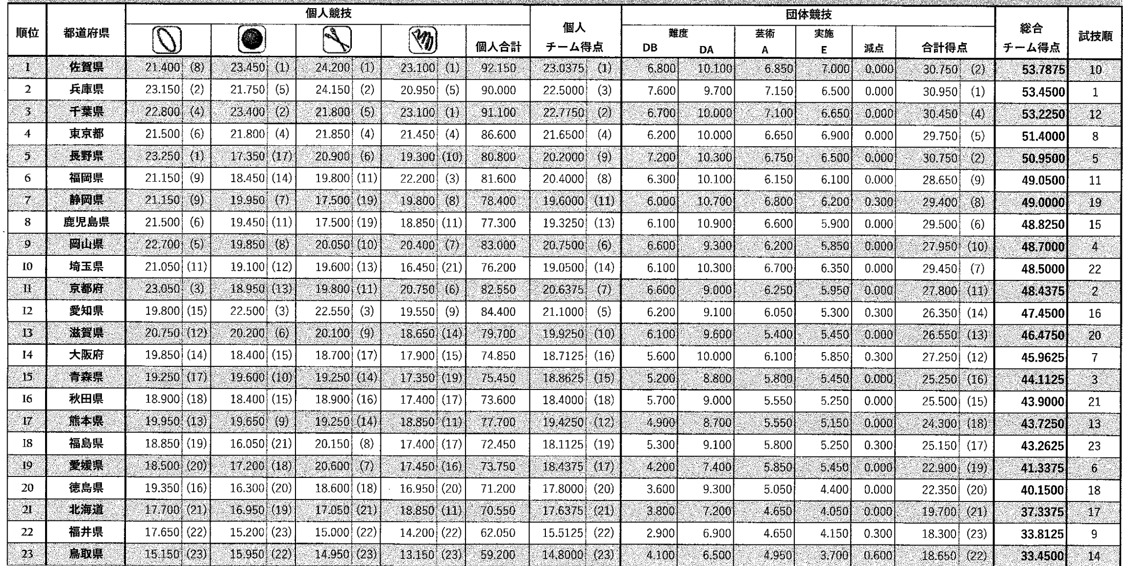
少年女子-総合成績一覧表