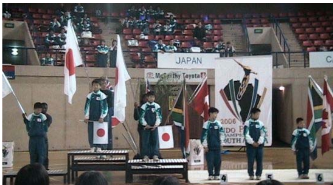
1 位~6 位まで日本選手が独占