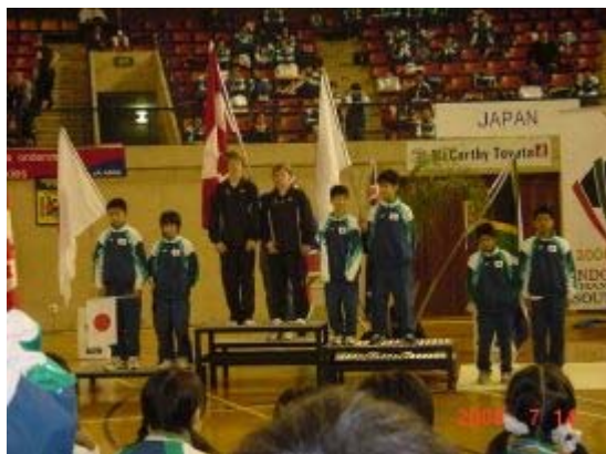
13~14 シンクロ男子 2.3.4 位