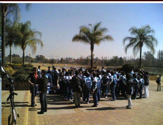
記念撮影前の集合