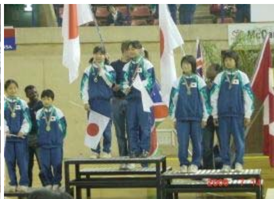
10~12 シンクロ 男女とも 1.2.3 の表彰台独占