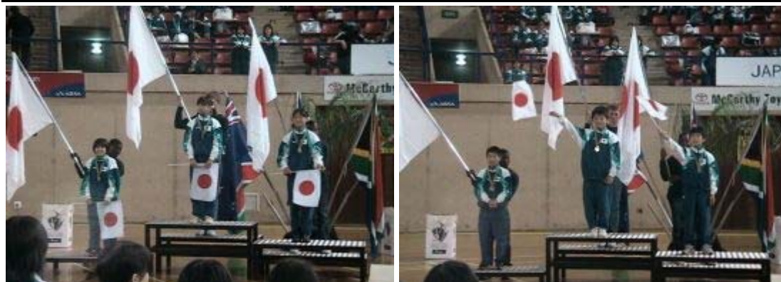
10~12 個人競技 1.2.3 の表彰台独占