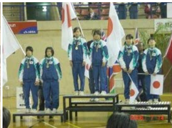
13~14 シンクロ表彰台独占