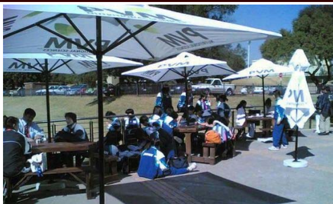
昼食会場にて休憩